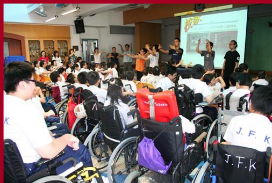
豐富多姿的學習經歷