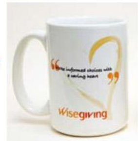
Wisegiving mug for donors 贈予捐款人的惠施紀念杯

知多一點 做個明智捐款人 Informed Donors Make Wise Choices